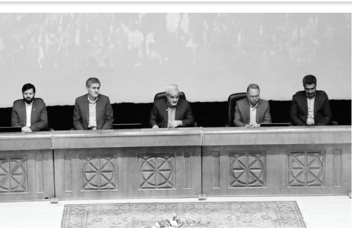
جلسه شورای اداری استان فارس

تعداد شرکت‌های دانش‌بنیان نشانه بهره‌وری نیست